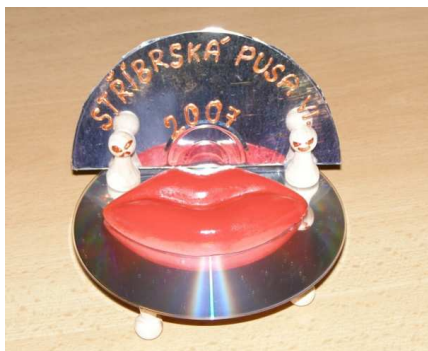
Pamětní plaketa pro účastníky.